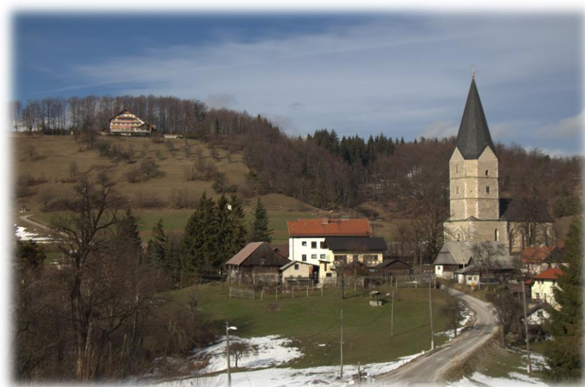
Svetina z Alminim domom v ozadju

Po Almi nosi ime tudi gostinsko-nastavitveni objekt Almin dom na Svetini, ki je bil nekaj časa zaradi nerešenih denarnih težav zaprt. Trenutno naj bi imel najemnika in je odprt ob koncu tedna. Uradno ime pa je Dom na Svetini.