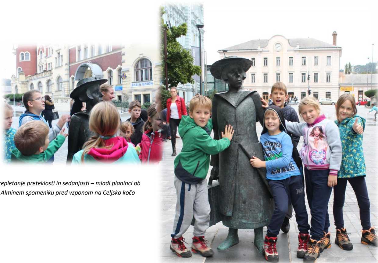
Prepletanje preteklosti in sedanjosti – mladi planinci ob Alminem spomeniku pred vzponom na Celjsko kočo

Po Almi nosi ime tudi gostinsko-nastavitveni objekt Almin dom na Svetini, ki je bil nekaj časa zaradi nerešenih denarnih težav zaprt. Trenutno naj bi imel najemnika in je odprt ob koncu tedna. Uradno ime pa je Dom na Svetini.