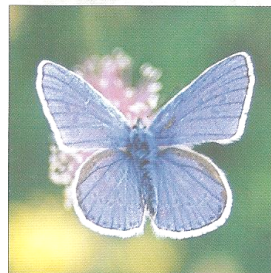
Navadni modrin ( Polyommatus icarus )